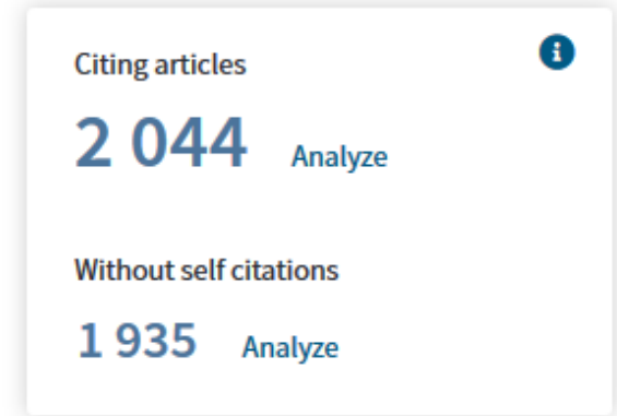
Sum of Times Cited per Year